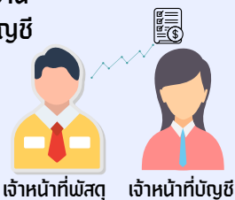
เจ้าหน้าที่พัสดุ เจ้าหน้าที่บัญชี

ผู้มีหน้าที่ควบคุมทรัพย์สินจัดทำรายงานตามแบบ 1 และ 2 ให้เจ้าหน้าที่บันทึกบัญชีของหน่วยงานตรวจสอบความถูกต้องและเสนอหัวหน้าหน่วยงานลงนามเพื่อส่งสำนักการคลัง ตามระยะเวลาที่กำหนด